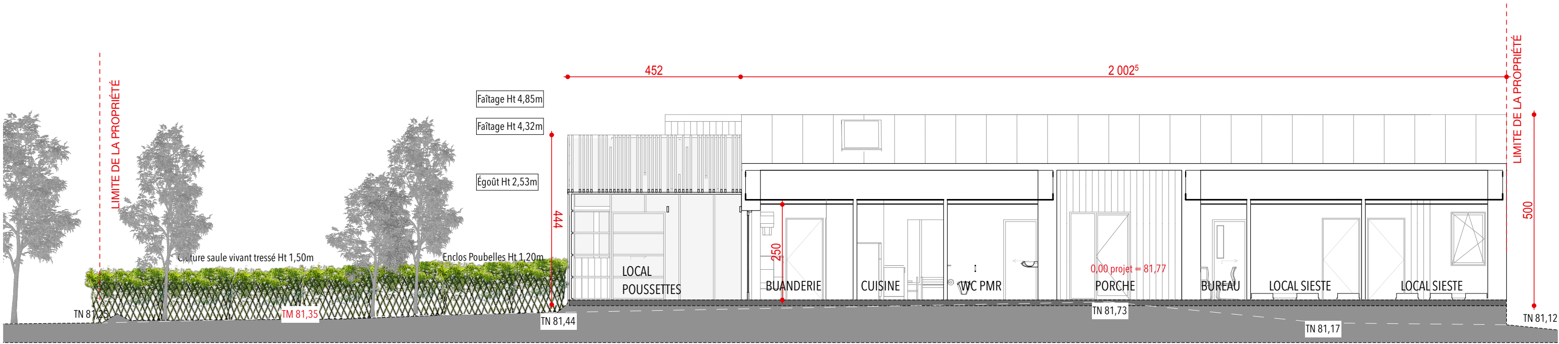
COUPE LONGITUDINALE 1:100